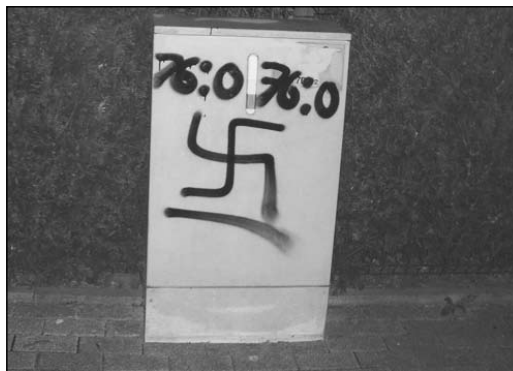
Graffiti von Neonazis in Hamm, das sich auf die Anschläge in Norwegen bezieht

Die FAZ setzt auf Sicherheitspolitik und auf »Vernunft«. »Vernunft« helfe gegen Wahnsinn und somit gegen Terrorismus, Überwachung des