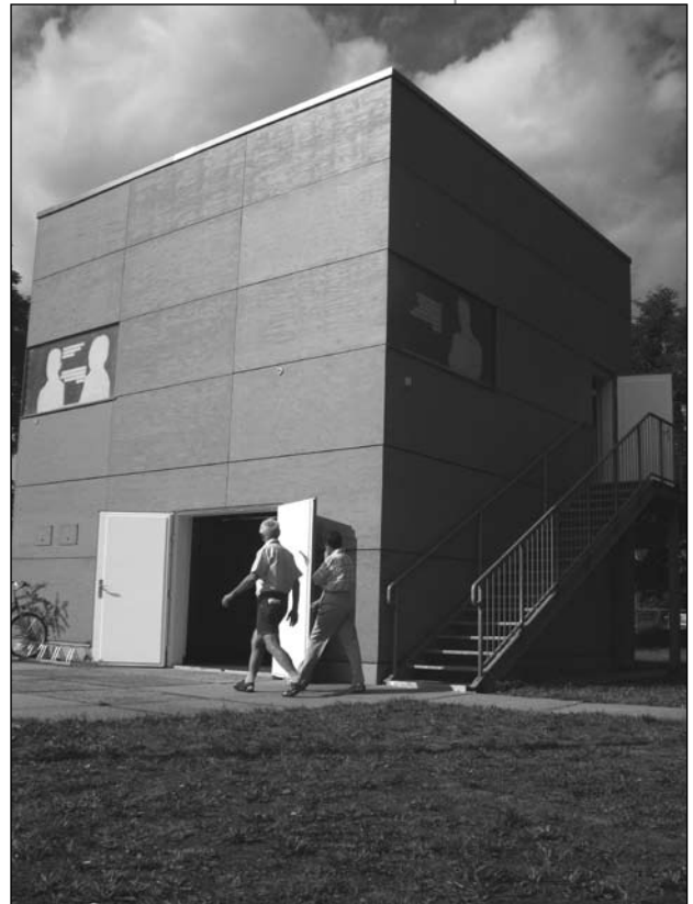
»Orange Box« auf der grünen Wiese in Hoyerswerda

bestimmter Erinnerungen oder sogar deren Diffamierung spricht nicht für einen selbstbewussten Umgang mit diesem Teil der Stadtgeschichte. Dass Vertreter_innen der weißen deutschen Mehrheitsgesellschaft auch heute noch beleidigt daran festhalten, gefälligst selber die Geschichte der Untaten ihrer Mitglieder schreiben zu wollen, das wird auch in den