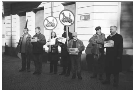
Pro Deutschlands »Kernmannschaft« bei einer ihrer Kiezaktionen im Oktober 2010 in Neukölln.