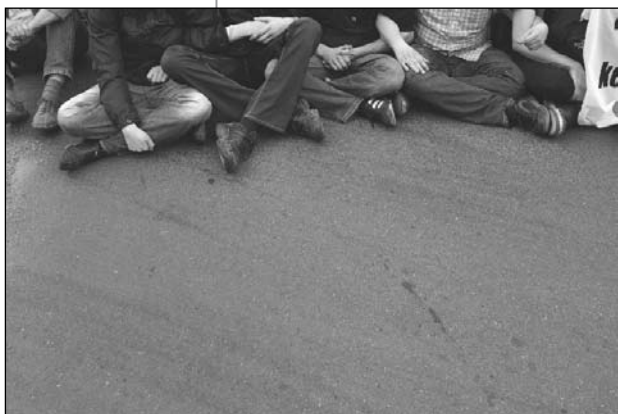
Blockade gegen Neonaziaufmarsch in Strausberg im Juni 2010