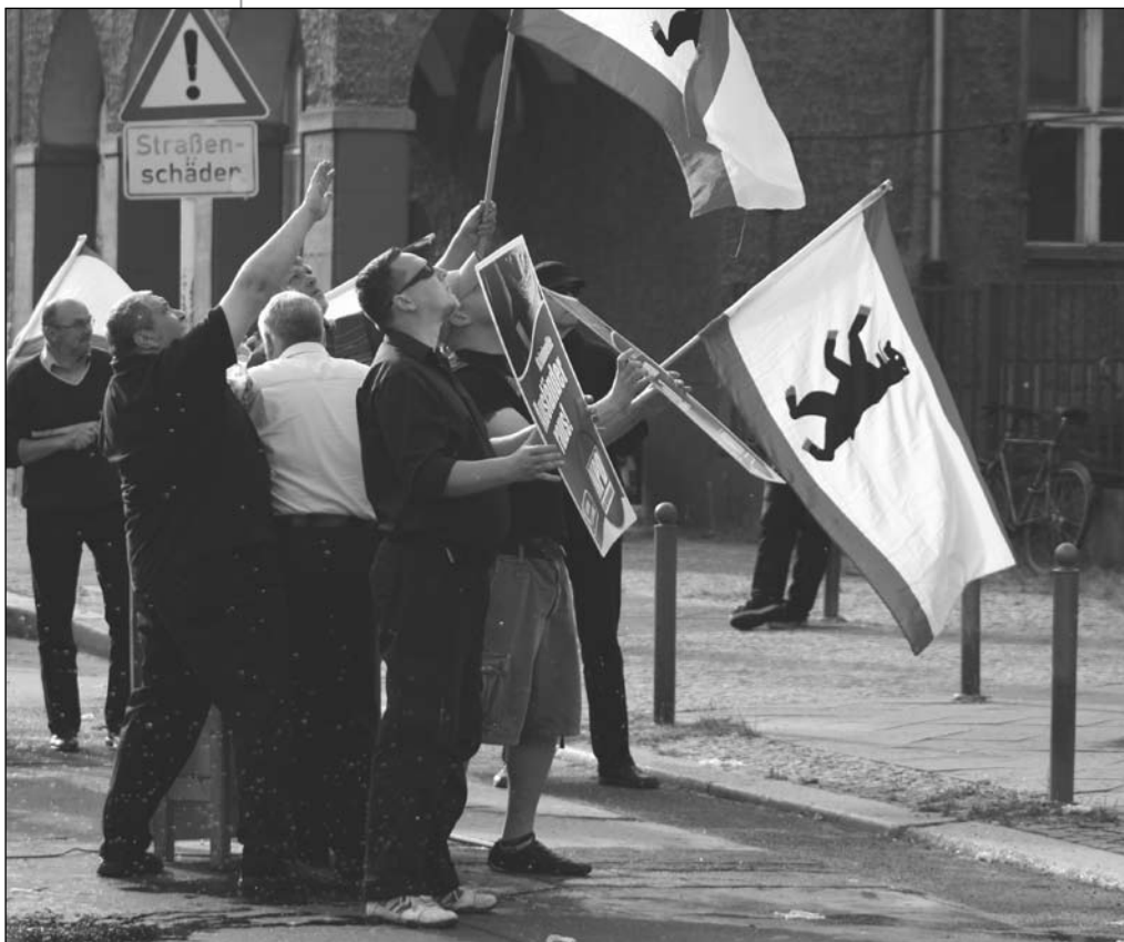
Neonazis schützen Udo Voigt vor »Wasserbomben« auf NPD-Kundgebung am 17.06. in Berlin-Mitte

erreicht werden. Dass wenige ehemalige DVU-Mitglieder auf den Listen stehen, verwundert nicht. In Berlin verlief die Fusion von NPD und DVU alles andere als harmonisch. Der DVU-Landesverband hatte gar geklagt und ihr ehemaliger Vorsitzender, TORSTEN MEYER, wird für PRO DEUTSCHLAND kandidieren.