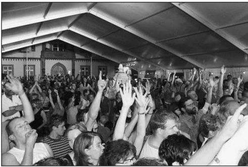
Basis einer Hetzjagd: Dorffest in Mügeln.

Die Bilder der verletzten indischen Männer, die im August von einer rund 50-köpfigen Gruppe junger deutscher Männer durch die sächsische Kleinstadt Mügeln gejagt wurden, machten international Schlagzeilen. In den deutschen Medien, die über Rechtsextremismus vor allem ereignisbezogen berichten, war die Berichterstattung vor allem von zwei Themen bestimmt. Von der Frage nach der rassistischen bzw. rechtsextremen Motivation für die Hetzjagd. Und von der Frage: Wo ist Familienministerin Ursula von der Leyen?