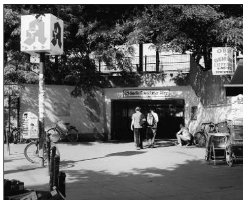
Immer wieder Tatort rechter Übergriffe: Der Berliner S-Bahnhof Frankfurter Allee.